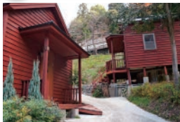
ご宿泊や日帰りBBQ キャンプ場