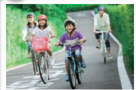
サイクリングコース