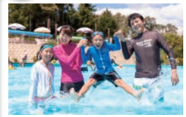
プール「フォレ・リゾ！」