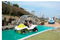
水陸両用サイクル and more