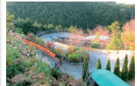
サイクルリージュ and more